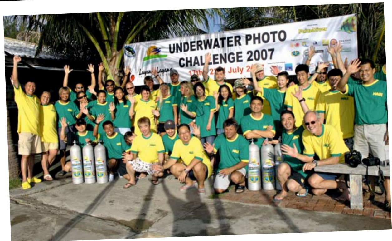
拉央拉央海島度假中心 17 - 23 July 2007

隨著2006年第一次的成功舉辦，拉央拉央海島度假中心(Layang Layang Island Resort)已成功地在2007年7月17日-23日舉辦了第二次的水底攝影比賽。從世界各地超過10個國家的參賽者及去年參賽的攝影愛好者聚集在一起參加比去年更具挑戰性的比賽。