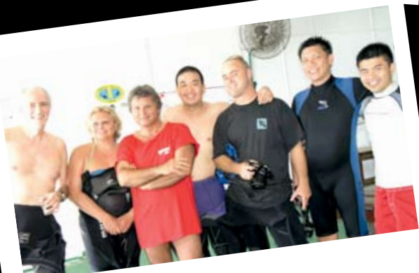
在休閒時間合拍一張照留做紀念。